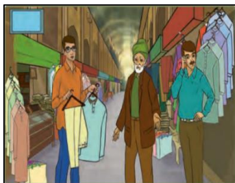
(عربی هفتم، ١٤٠٠: ٧٢)