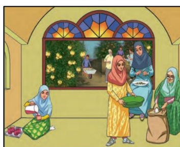
تصویر ۱۱: نمونه‌ای از محیط بومی خانواده