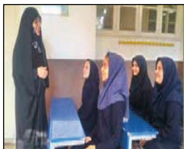
تصویر ۱۰: نمونه‌ای از محیط بومی مدرسه