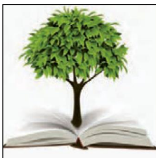
تصویر ۵: نمونه‌ای از فرایند مفهومی تحلیلی (عربی هشتم، ۱۴۰۰: ۳۷)