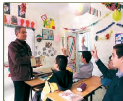
تصویر ۱: نمونه‌ای از فرآیند روایتی گذرا