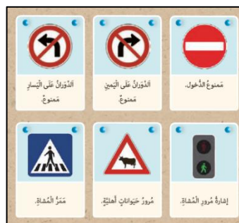
تصویر ۳: نمونه‌ای از فرایند مفهومی طبقه‌بندی (عربی نهم، ۱۴۰۰: ۲۴)