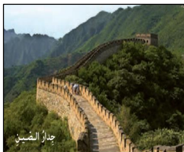
تصویر ۱۲: نمونه‌ای از محیط غیربومی منطقه‌ای