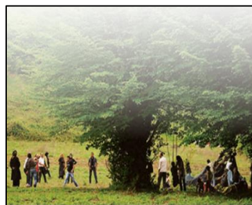
تصویر ۹: نمونه‌ای از محیط بومی جامعه