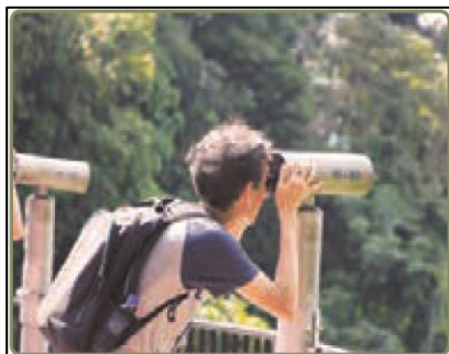
تصویر ۲: نمونه‌ای از فرآیند روایتی ناگذرا